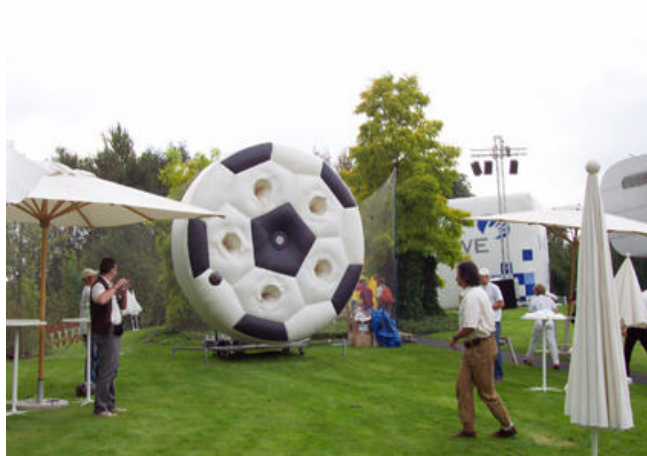
Tor, Tor, Tor: Ein wenig sportliches Geschick ist auch bei der Riesentorwand gefragt...

Die Torwand des 21. Jahrhunderts wurde „open-air“ auf einer Messe eingesetzt, um für das „weltmeisterliche“ Produkt zu werben. Ein toller Erfolg! Für die Teilnehmer gab es handgenähte Fußbälle zu gewinnen. Außerdem lockten Eintrittskarten für Top-Fußballspiele.